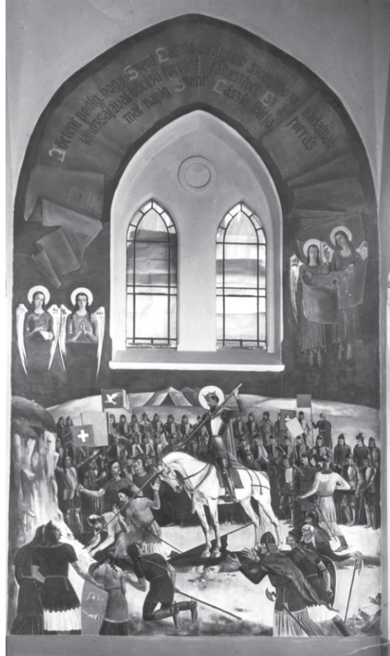
Jászszeptandrás 108. o.