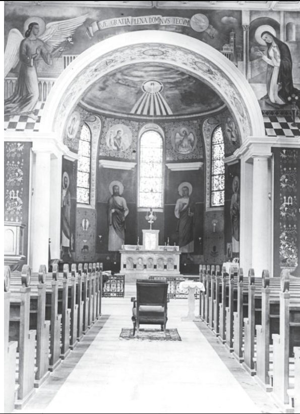
Szolnok; fotó: Chiovini Ferenc 125. o.